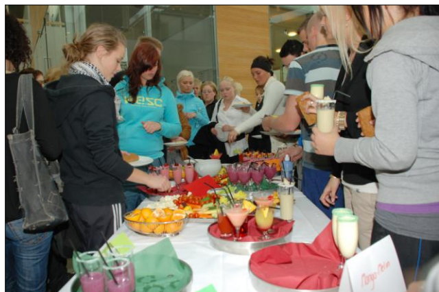
Fra temaugen Sundhed og velvære

Med årsskiftet ser vi tilbage. Vi glæder os over succeser og sætter mål for udvikling i det kommende år.